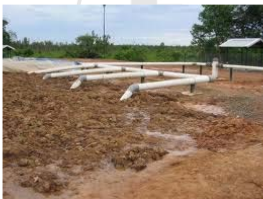
Obr. 3 Halda vedená v režimu techniky biopiling, která je vhodná pro zpracování ropou znečištěných zemín

Ex situ technologie nakládání s kontaminovanými matricemi s ropnými látkami mají společného jmenovatele v přemístění materiálu do systému zařízení, kde lze provádět jeho cílenou dekontaminaci. Nejčastěji jimi bývají dekontaminační plochy vybavené distribučními systémy pro rozvod nutrietů, vody, suspenzí biodegradčních populací (inokul) a vzduchu. Nabízí se využití techniky biopiling, kdy je kontaminovaná matrice vylehčena přidavkem biologického materiálu (např. drcená dřevní hmota), čímž se výrazně zvýší pravděpodobnost úspěchu dekontaminace. Osvědčuje se zejména u kompaktních typů znečištěných matric, jakými jsou jílovité zeminy nebo sedimenty.