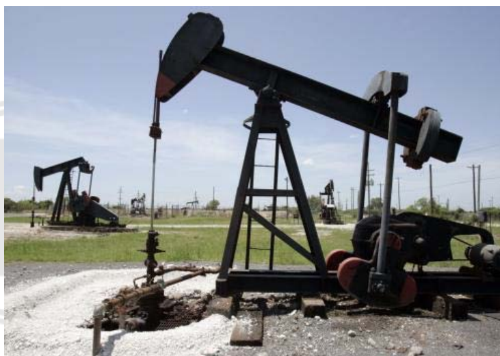
Obr. 1 Ukázka dlouhodobě (ropnými látkami) exponované lokality – ropné pole