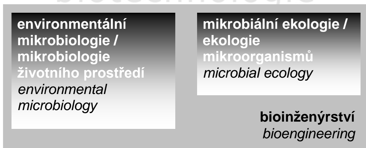
Obr. 1 Teoretická východiska pro bioremediace

Komplexnost přístupu, který v oblasti aktivního nakládání s kontaminacemi v životním prostředí bioremediace představují, je znázorněna na obrázku 1. Teoretické rámce sloužící jako zdrojové soubory informací, vodítka pro optimální volbu metod, jak shromáždit dostupné poznatky a jak rozšířit znalost klíčových faktorů majících vliv na použití správných nástrojů v procesu konstrukce konkrétní biotechnologie, resp. konstrukce sanačního zákroku na bázi aplikace biologického činitele obecně, představuje v primární fázi environmentální mikrobiologie a mikrobiální ekologie. Tyto disciplíny mají výrazně interdisciplinární charakter a v mnoha ohledech se prolínají a informačně doplňují a podporují. Environmentální mikrobiologie jako podobor mikrobiologie shromažďuje poznatky o biologických činitelích, mikrobiální ekologie je disciplína o vztazích ve všech rovinách interakce biologického činitele a prostředí jeho výskytu. Zastřešujícím oborem s přímým vlivem na konstrukci vlastní technologie je bioinženýrství, které disponuje prostředky, jak technicky vytvořit optimální podmínky realizace bioremediačního zákroku.